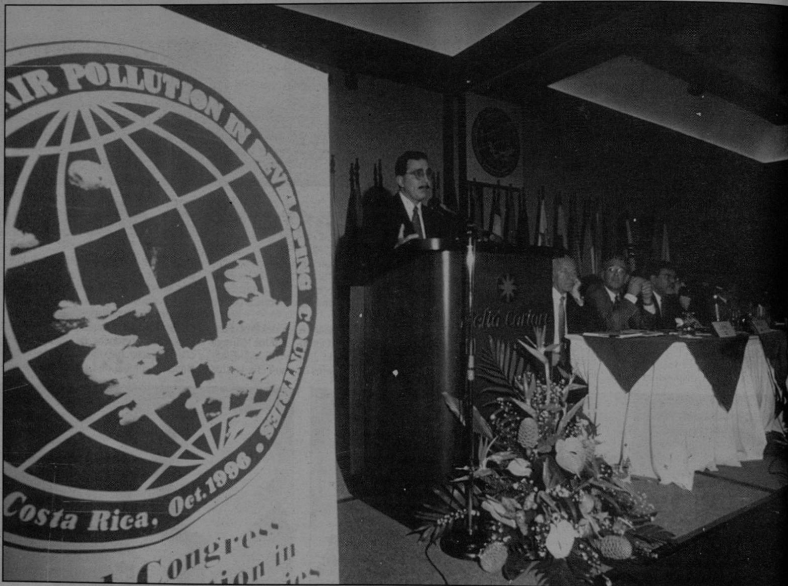
El Ministro René Castro en el acto inaugural de la conferencia sobre la contaminación del aire.